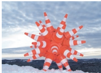
In Out , Plots de signalisation, bois, miroirs en verre de rétroviseurs, miroirs ronds, miroirs bombés, Assemblage vis et silicone, 170 cm Ø, Photo Guillaume Rude